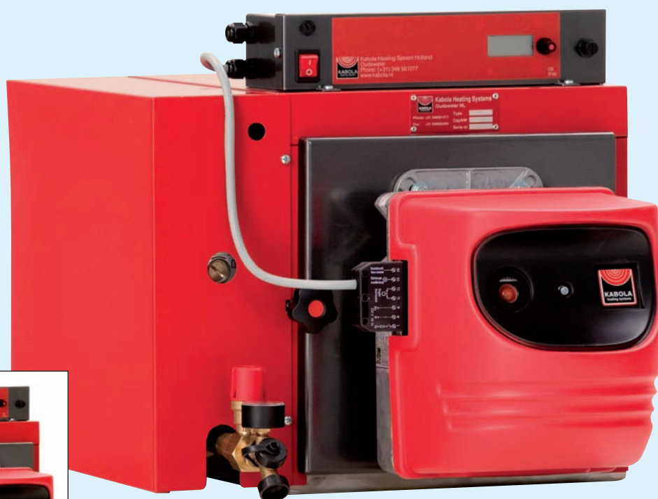
HR 400 combi