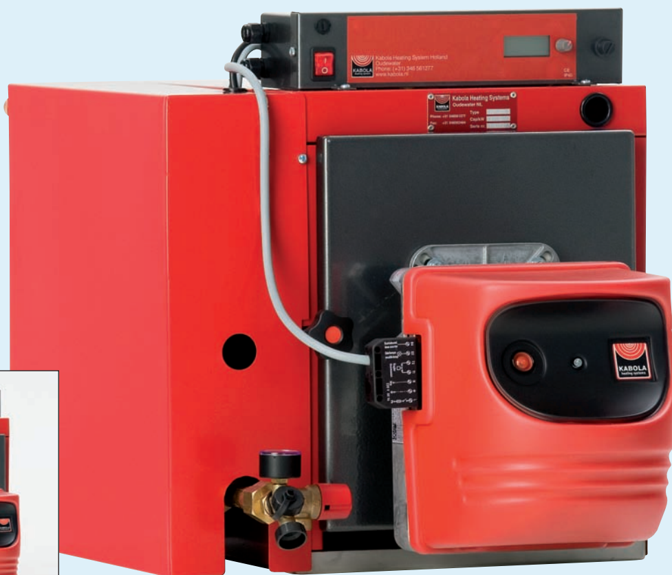
HR 500 combi